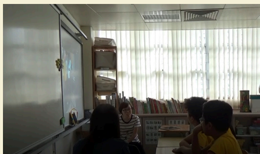
學生加入電視台的設備，如：背景綠幕、錄影機。