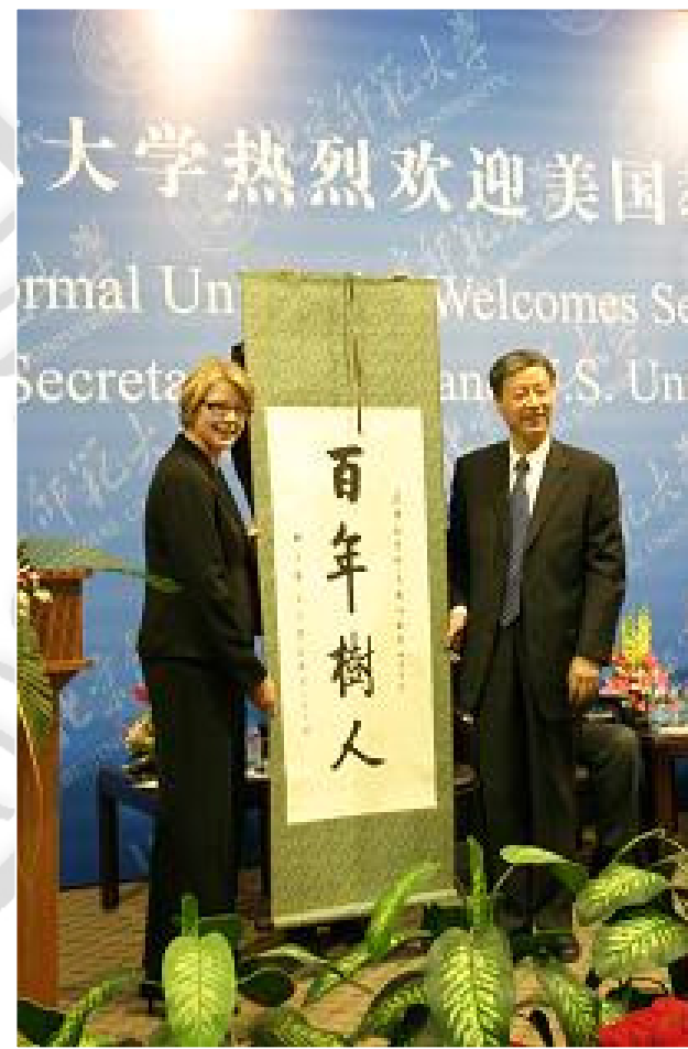
2006年，美国教育部长来访。