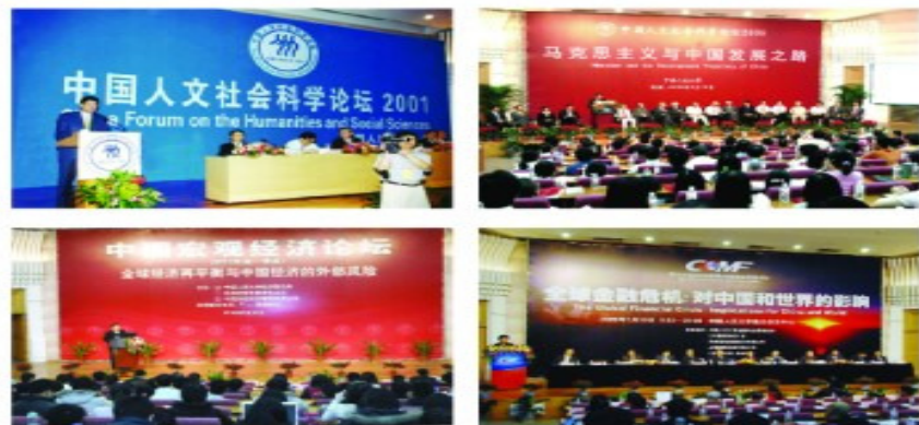
举办中国人文社会科学论坛、中国宏观经济论坛、中国资本市场论坛等一系列高端学术活动

我校举办一年一度的“中国人文社会科学论坛”，已成为中国思想界、理论界和学术界最具影响力的重大年度活动之一。