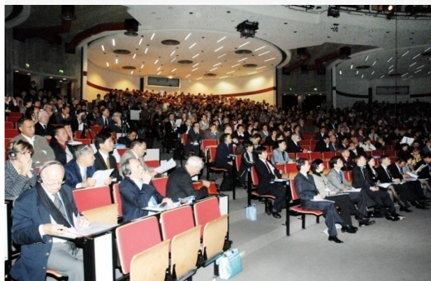
2007年10月，中国人民大学在布鲁塞尔成功举办中欧论坛