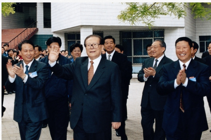
2002年4月28日，江泽民同志亲临学校考察