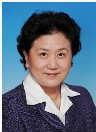
中共中央政治局委员、国务委员刘延东