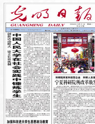
光明日报中国人民大学学生社会实践