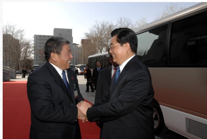
2008年3月15日，胡锦涛总书记来到中国人民大学出席“中日青少年友好交流年”开幕式