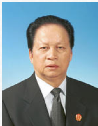
原最高人民法院院长肖扬