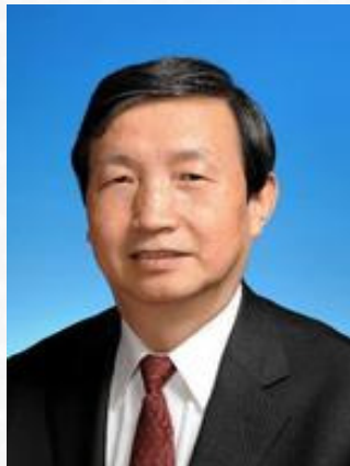
中央委员、国务委员马凯