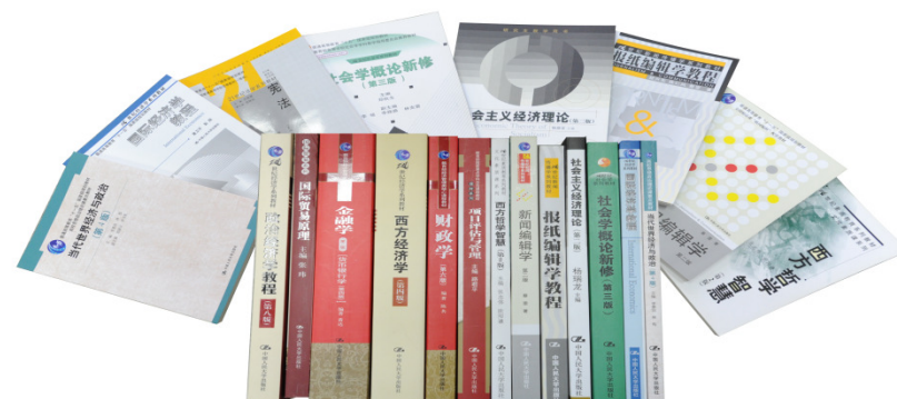
中国人民大学编写出版了一大批国家精品教材和高水平研究成果。