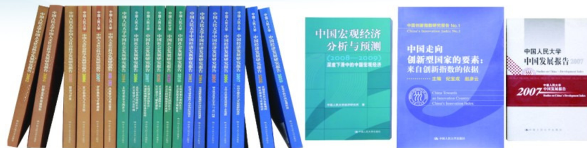
发布“三大指数”“三大报告”，引起广泛影响

我校举办一年一度的“中国人文社会科学论坛”，已成为中国思想界、理论界和学术界最具影响力的重大年度活动之一。