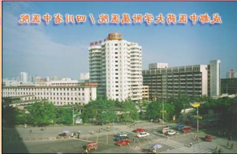
全國示範中醫醫院 國家三級甲等綜合性中醫醫院