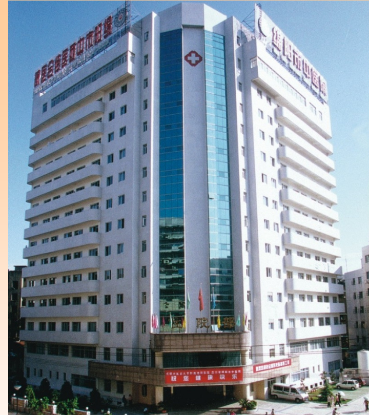
附屬綿陽中醫醫院