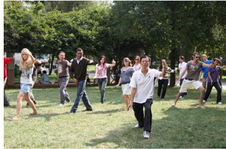
外国留学生在我校学习