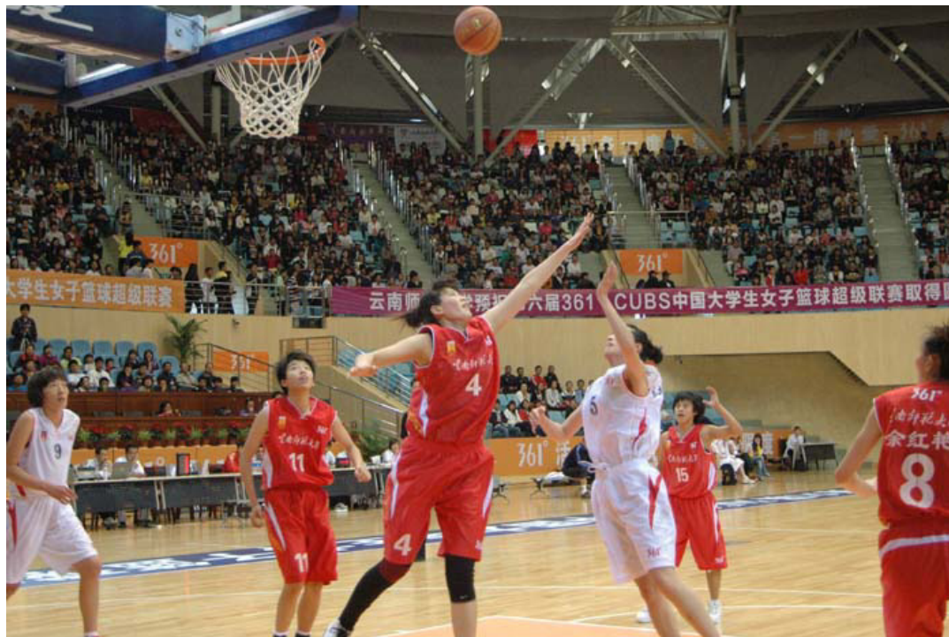
我校女篮获得第六届 361°CUBS 中国大学生女子篮球超级联赛第三名