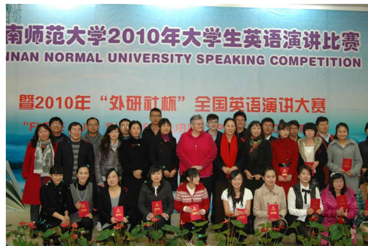
创新人才培养模式，提高学生综合素质