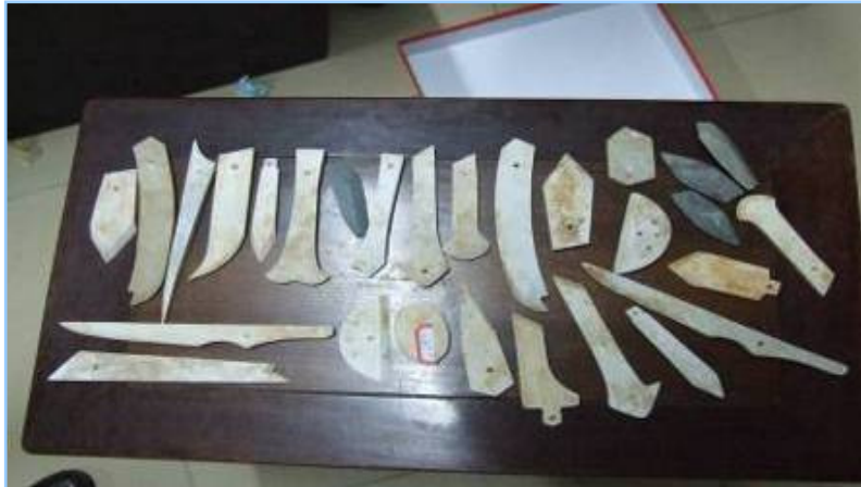
新石器時代良渚文化醫用器具