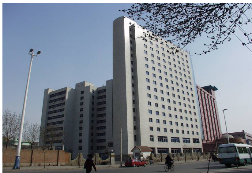
學生宿舍 (天中賓館) Dormitory (Tianzhong Hotel)