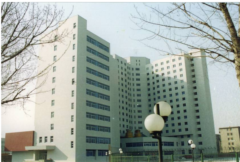
國際教育學院 International Education College Building