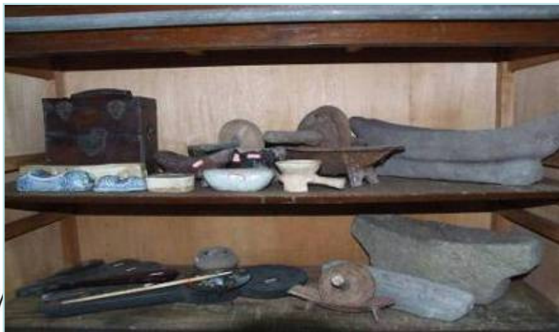
自宋至清各時期脈枕、碾船、藥戥子

Different Mortars in Ming & Qing Dynasty