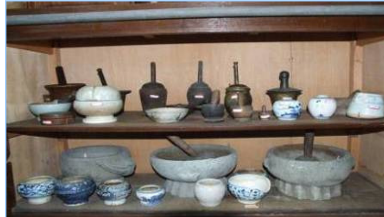
明清各時期不同材質的研鉢、藥臼

Different Mortars in Ming & Qing Dynasty