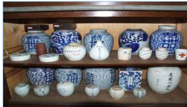
清—民國時期各式藥罐

Wrist-cushion and roller from Song to Qing Dynasty