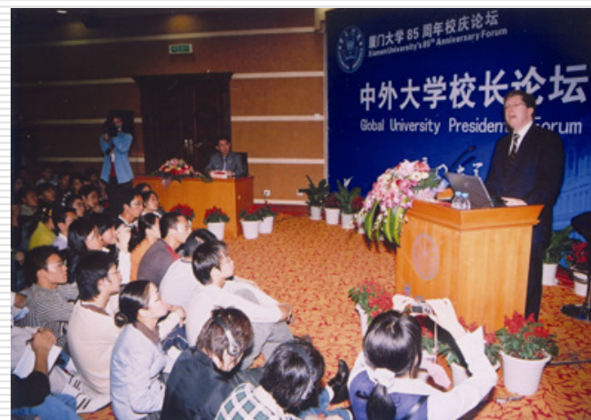
中外大学校长论坛

■ 我校每年配合团中央、台联、青联等组织举办海峡两岸大学生夏令营、联欢、座谈和节庆活动等；鼓励港澳台学生参加各类校园文化活动。