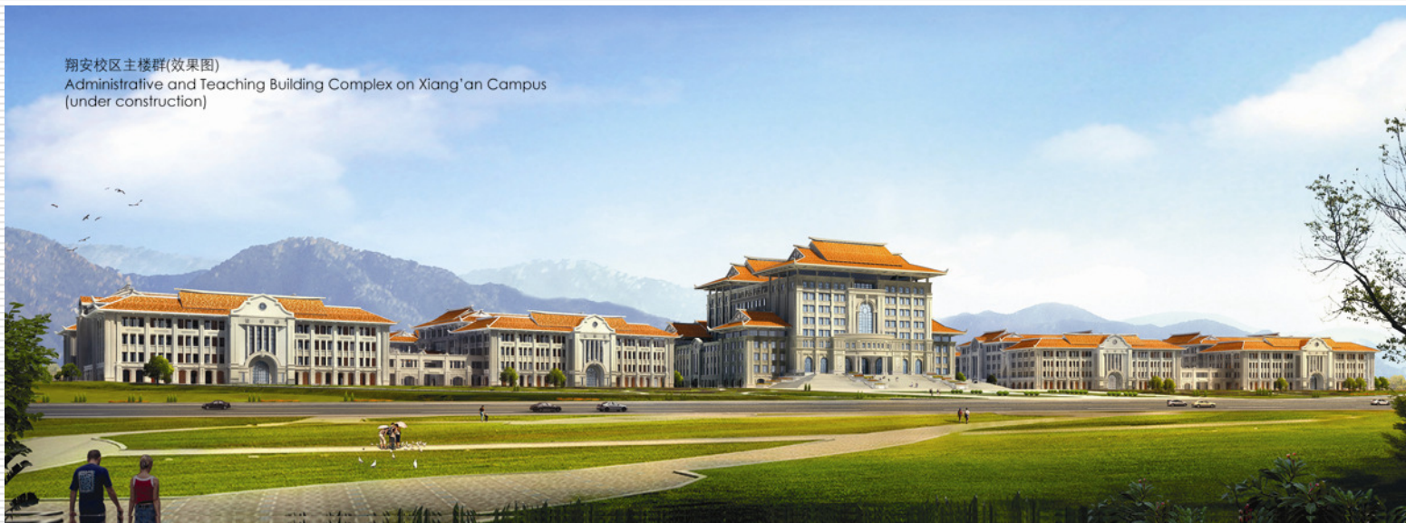
翔安校区主楼群(效果图) Administrative and Teaching Building Complex on Xiang'an Campus (under construction)