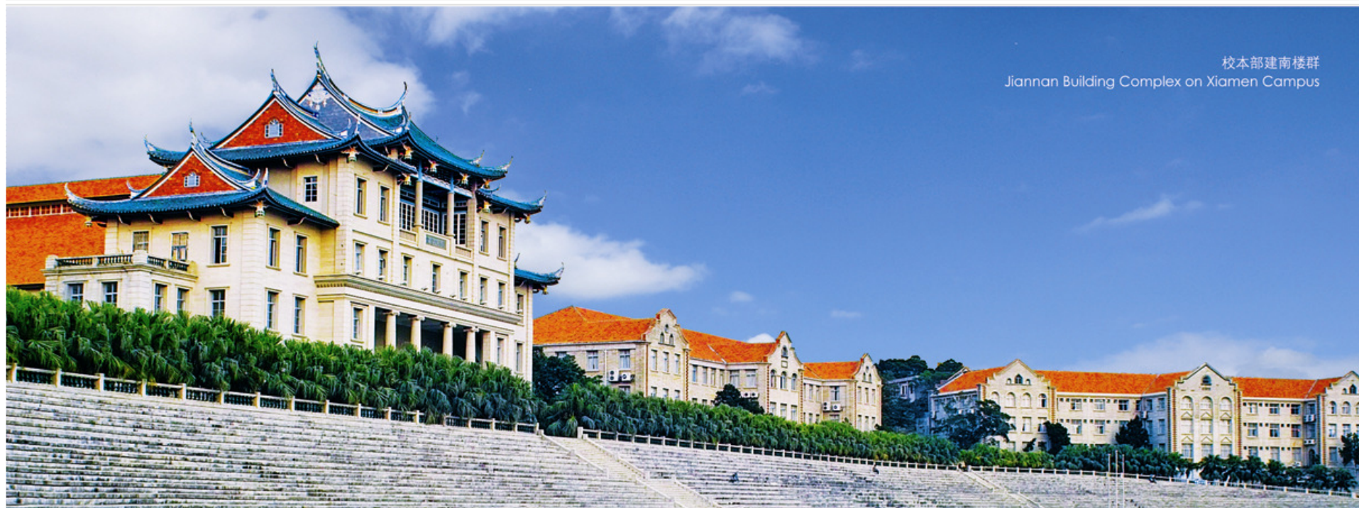
校本部建南楼群 Jiannan Building Complex on Xiamen Campus