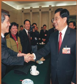
2007年3月8日，黨中央總書記、 國家主席胡錦濤與黨委書記歐可平同志親切握手