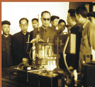
1960年國務院副總理賈崇臻來校視察