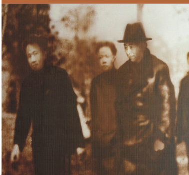
1938年、1946年周恩來曾兩次來重慶為學生運動作演講