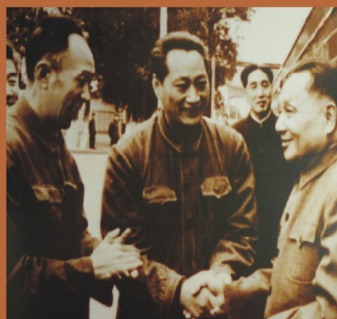
1978年、鄧小平同志接見 重慶校友、大慶黨委書記李庚庚同志