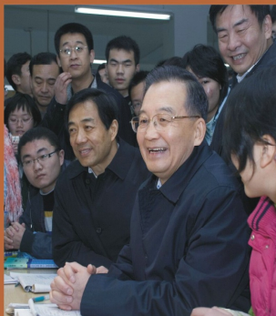
2008年12月22日，中央政治局常委、 國務院總理溫家寶視察學校，並與師生親切交談