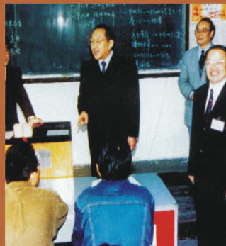
1997年，時任中央政治局常委、 國務院副總理李鳳清同志視察重慶建築大學