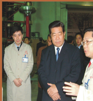
2004年，中央政治局委員、 全國政協主席賈慶林參觀學校高壓實驗室