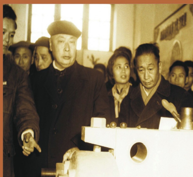
1959年國務院總理、外交部部長陳毅來校視察