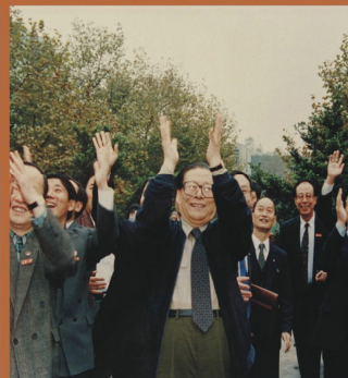
1994年，時任中共中央總書記江澤民來學校視察