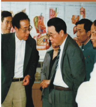
1987年，時任中央政治局委員、 國務院副總理李鵬來學校視察