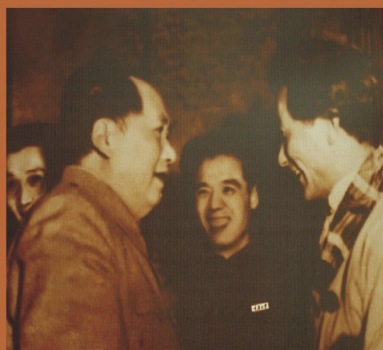
1957年國家主席毛澤東接見 全國學聯副主席、重慶學生會主席葉紹兵同志