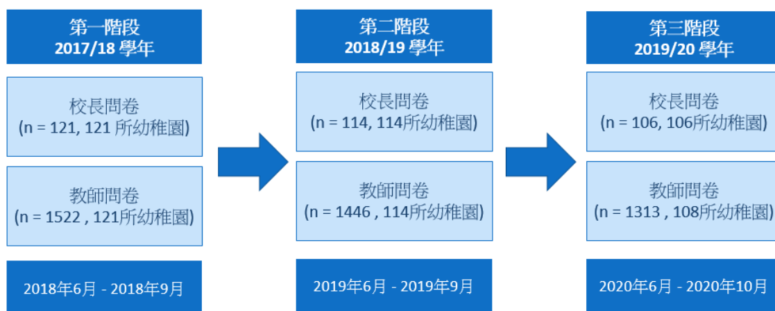
圖 2：研究第一部分採用的研究設計和參與人數 2