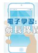
電子學習：家長錦囊