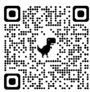
「共建更好的網絡世界」 電子學習資源套