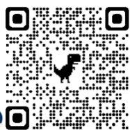
《健康網絡由你創》短片系列 (家長篇)