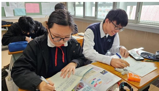
同學在課堂上認真完成反思課業

到了下學期，本校老師對課程詮釋更有信心，並於課程實施時進行班本調適，以兼容不同老師的教學風格和學生的多樣性。與此同時，同工亦作出一項全新嘗試－設計反思課業。此課業有別於傳統、公開試模式的資料回應題。它的形式靈活，同學所需書寫的篇幅亦較短，故能夠在課堂內完成，有助老師適時了解同學對不同課題的掌握，可說是非常有效的進展性評估。課業內容相對輕鬆，同學一方面運用課堂所學作答，另一方面可表達個人感受和見解，同學因而相當樂意完成此習作，就各個課題深入反思。