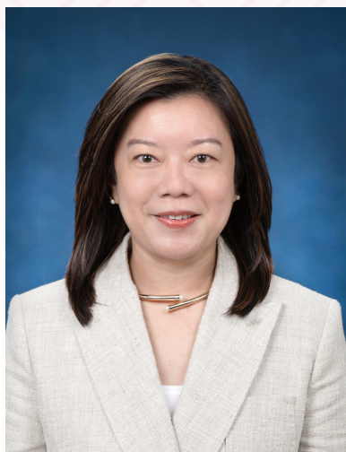
現任教育局常任秘書長 陳穎韶女士