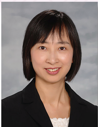
上任教育局常任秘書長 李美嫦女士