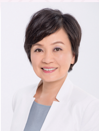
教育局局長蔡若蓮博士