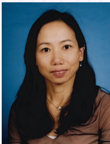
教育局副秘書長 李碧茜女士