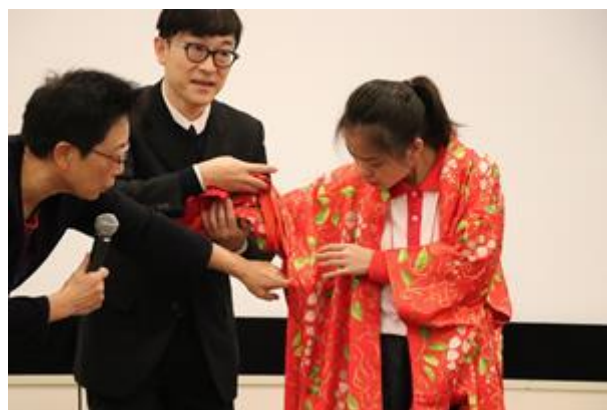
同學試穿日本傳統服飾