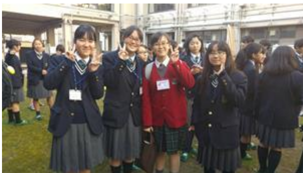
經過一整天交流，大家都感到依依不捨