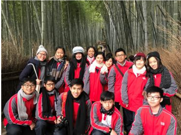
嵐山一帶的竹林景色令大家陶醉其中

代表團早上先前往嵐山及渡月橋，充分感受京都的寧靜景色和古都風情，其後一同參與傳統印染工藝，製作獨一無二、屬於自己的小手帕；飯後驅車前往京都市環境保全活動中心，透過義工嚮導的介紹，了解日本在應對各種環境問題時所採取的措施，令同學反思值得香港借鏡之處，之後再到京都國際漫畫博物館參觀，在這所古老的建築物裡親身體驗日本漫畫文化的魅力，不少同學都在這裡找到心愛漫畫的創刊號呢！