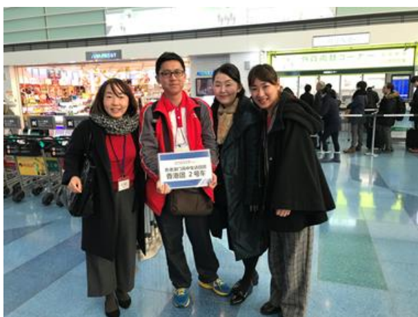
聚散有時，期待有緣再會