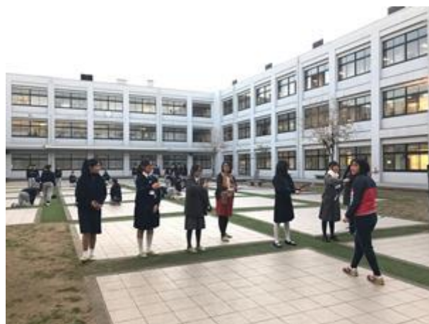
香港學生對舞棒非常感興趣