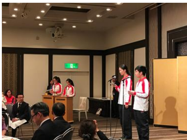
同學們藉此分享見聞及心得，並表示衷心的感謝