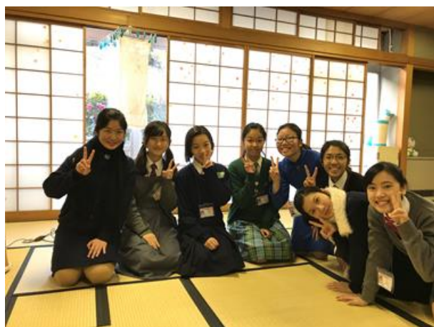
女同學們十分享受在茶道部的時光