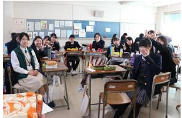
雙方師生共晉午餐