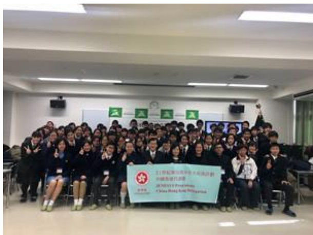
全體交流人員的大合照