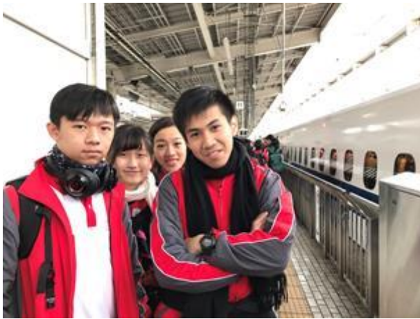
準備乘坐新幹線從京都返回東京

黃昏時分，大家都滿載而歸，隨即出席在下榻酒店所舉行的歡送報告會；晚會在日中友好會館專員的精心籌劃下得以順利進行，並得到中日兩國相關官員蒞臨指導，香港學生藉此機會除了對眾多支援 JENESYS 計劃的團體人員表示衷心感謝，還分享了他們在旅程中的所見所聞，並表示返港後必定會和他們的家人、師長、同學和朋友分享這次難忘的旅程；期間日中友好會館的工作人員更為一位香港學生和澳門團的領隊老師送上生日祝福，為晚會添上更多的歡樂。