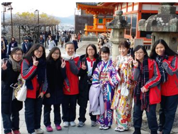
同學們在清水寺和穿和服的少女們合照