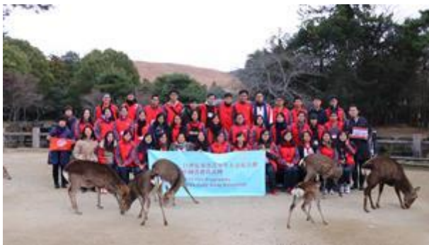
和自由散步的小鹿合照