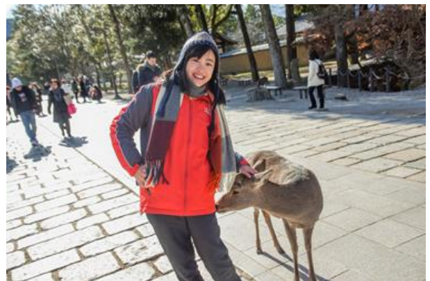
小鹿很惹人憐愛呢