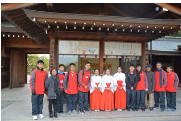
大家一起準備晚餐