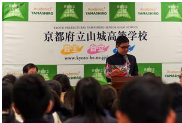
香港領隊老師代表致詞

下課後，當地學生帶領香港學生到不同的課外活動場地參觀，包括劍道部、舞蹈部和舞棒部等，而舞棒活動在香港甚為少見，香港學生對此大感興趣；在當地學生的細心指導下，不少同學都能在短時間內掌握一些轉動舞棒的技巧和表演方式，這個難忘的課外活動為整天的訪校寫下了完滿的句號。