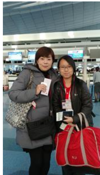
謝謝你們連日來的專業照顧