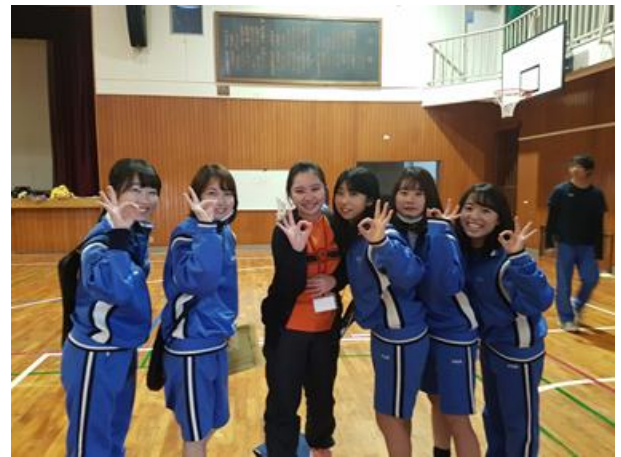
參與不同球類活動