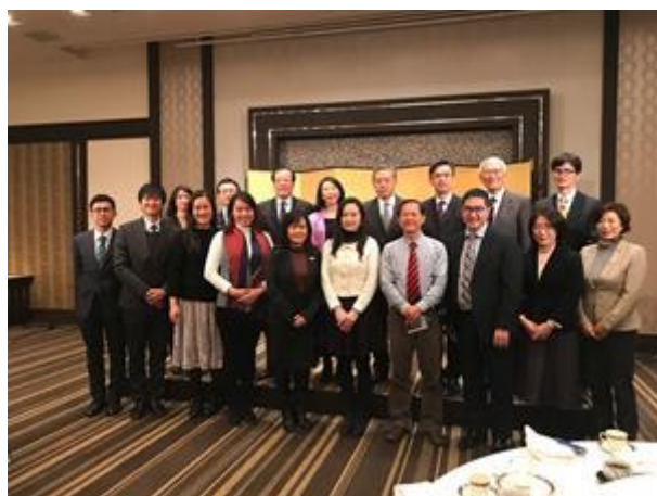
大家的努力令訪日旅程得以順利完成