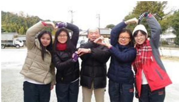
同學們和寄宿家庭合照留念

代表團早上先參與寄宿活動離宿儀式，縱使只是一晚，同學們都和寄宿家庭建立了深厚且真摯的情誼，大家都感到依依不捨，期待他日再重聚。其後驅車前往奈良縣的東大寺參觀，同學們都對寺裡自由散步的小鹿很感興趣，爭相拍照；飯後再到京都府的清水寺遊覽，進一步了解日本的歷史發展和廟宇文化。晚上代表團入住位於滋賀縣的溫泉旅館，除了享受豐富的會席料理外，還一邊露天浸溫泉，一邊眺望優美的琵琶湖風光。