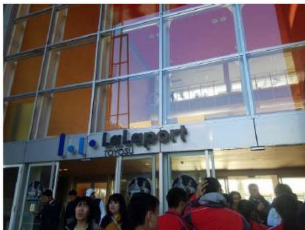
大家把握時間，考察商業設施