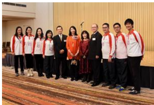
雙方人員合照留念