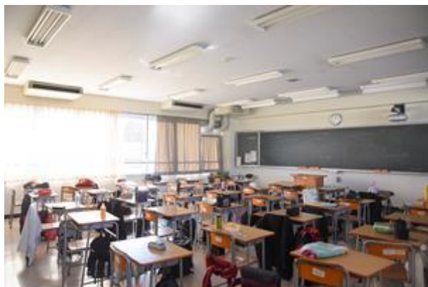
到訪東京都立翔陽高中