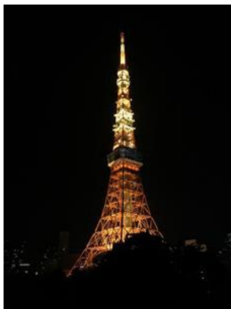
酒店外望東京鐵塔