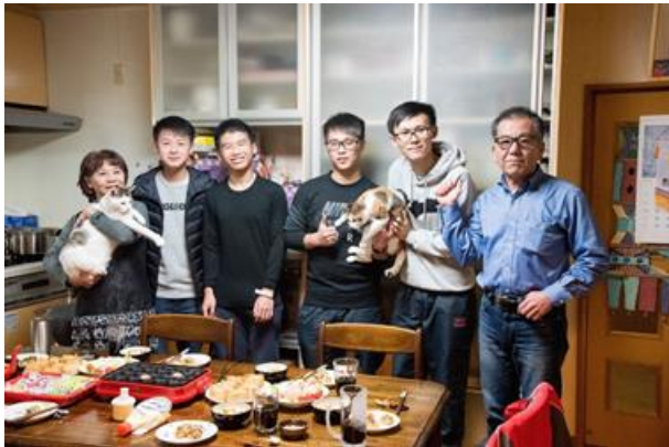
和寄宿家庭參觀橿原神宮