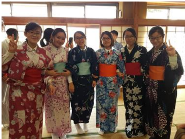
女同學穿上和服體驗