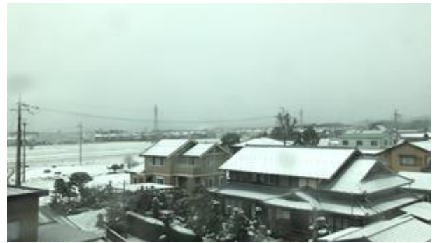
在車上看到下雪了！！