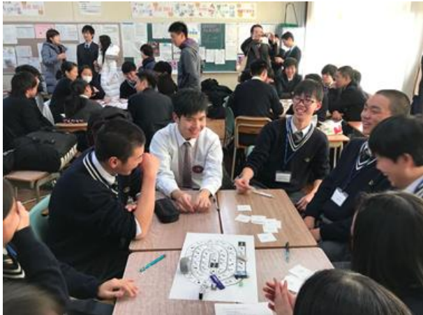
透過比賽進行交流