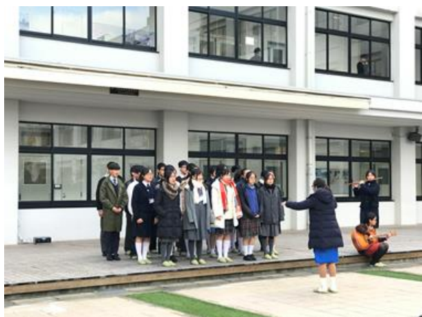
香港學生的舞蹈和唱歌表演也很精采