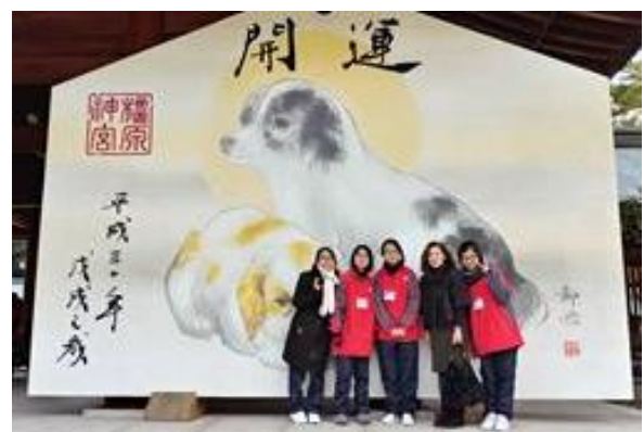
同學們很快便和寄宿家庭打成一片