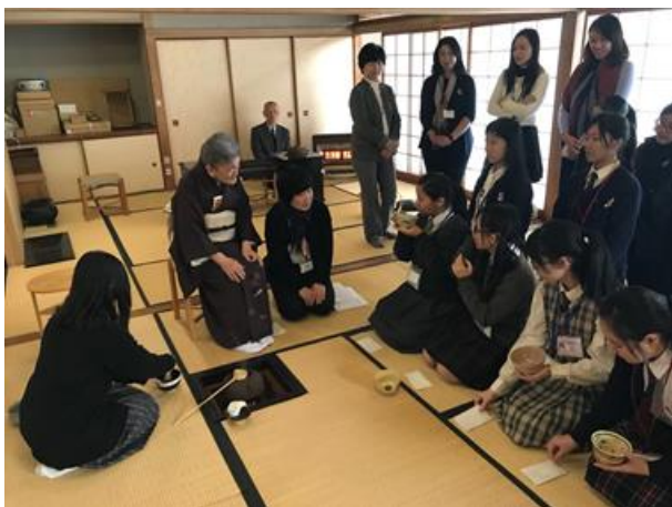
全神貫注學習茶道