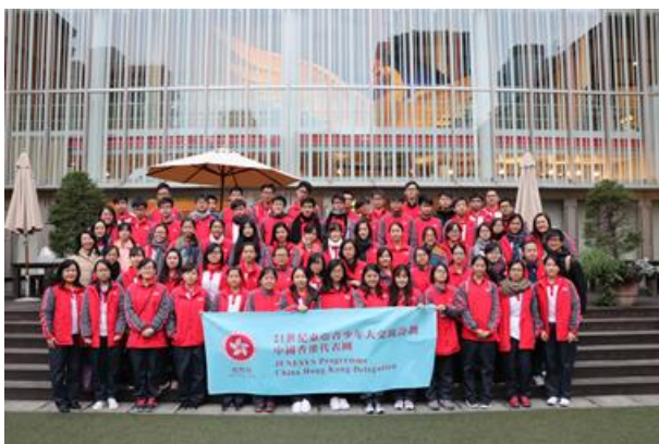
全團人員在京都國際漫畫博物館外合照留念