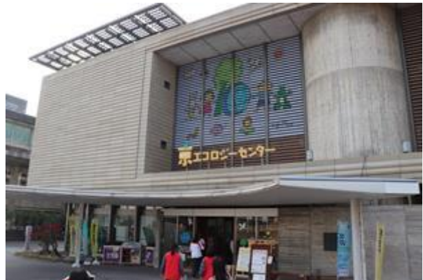
參觀京都市環境保全活動中心