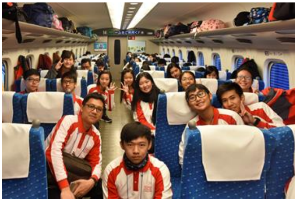
乘坐新幹線由東京到新大阪，再轉往奈良

代表團在早上先到東京站，然後乘搭新幹線到新大阪站，期間體驗領先世界潮流的高速鐵路，再轉旅遊巴士前往奈良飛鳥地區參與寄宿活動入村儀式。同學分批與寄宿家庭會面，然後展開難忘的寄宿生活；不同的寄宿家庭各有安排，有的帶領同學參觀當地廟宇，藉此加深對日本歷史的了解，有的則往山上走，感受當地的優美景色，有的則由寄宿家庭的媽媽和同學們一邊預備當天的晚飯，一邊分享大家的日常生活和飲食文化；這天晚上同學們各自有不同體會，透過與一般日本家庭的相處，感受到非一般旅遊可以得到的寶貴經驗，相信至今仍令同學難以忘懷。