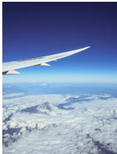
相信這次旅程會永遠留在大家的心中