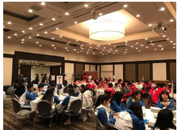
香港團和澳門團一起出席歡送報告會