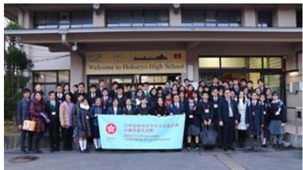
全體交流人員的大合照