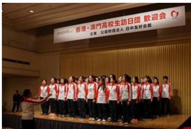
香港學生表演大合唱