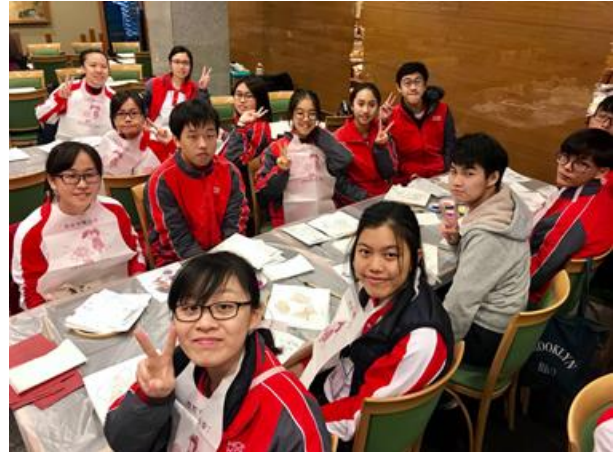
參與傳統印染工藝