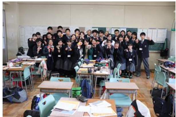
香港學生參觀課堂