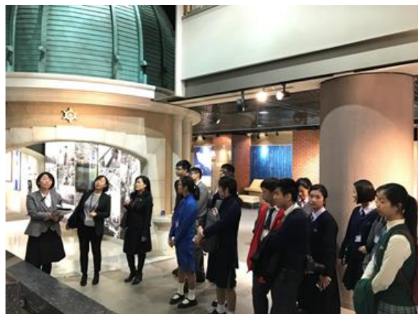
同學正在細心聆聽有關東京自來水的發展故事