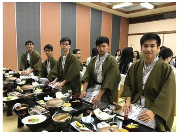
大家穿上浴衣，享用豐富的會席料理