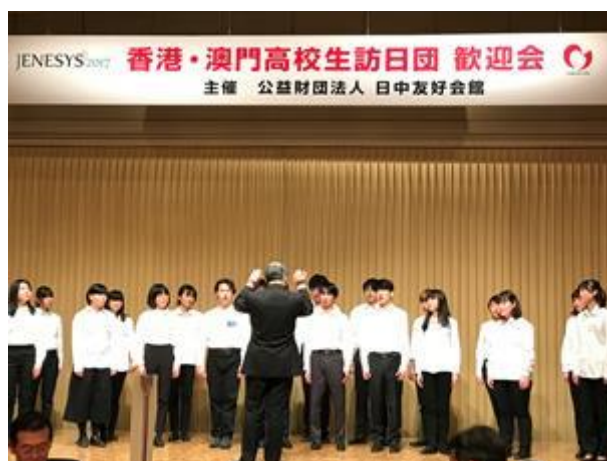
日本學生表演歌唱