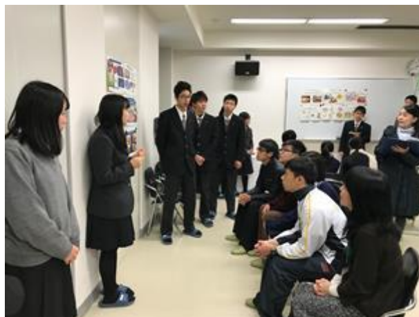
香港學生正細心聆聽有關日本傳統文化的講解