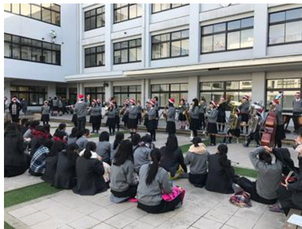
山城高中的吹奏樂部在校園中庭表演聖誕歌曲