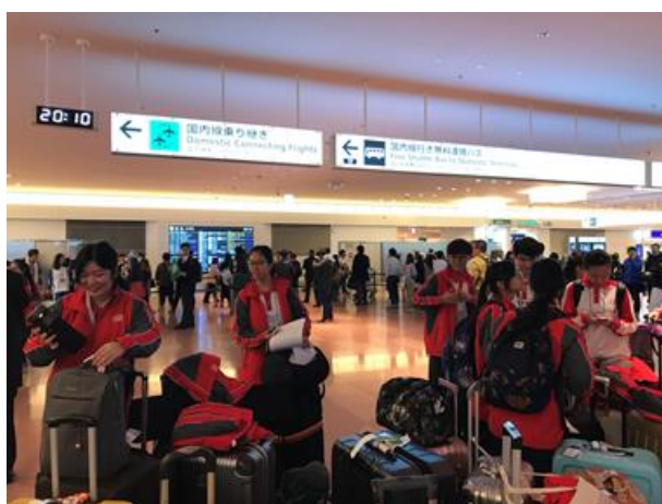
抵達東京羽田機場