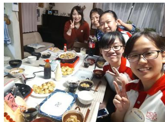
看來同學們的肚子今晚都會「滿載而歸」