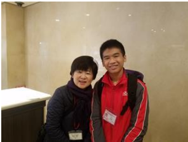
不知不覺到了離別時候

大清早代表團便離開酒店，驅車前往東京羽田機場，準備乘坐航班返回香港。入關前，香港學生都對陪伴了他們多天的專業導遊人員表現得依依不捨，爭相與他們合照，並再一次表達深厚的謝意。當飛機順利降落香港國際機場後，「JENESYS 2017」香港代表團的訪日活動正式圓滿結束，平安解散；深信大家在這個旅程中所建立的深厚友誼不會因此流逝，期待他朝有緣再聚。