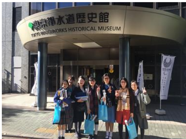
參觀東京都水道歷史館

第二分團的同學在離開酒店後，先前往「東京都水道歷史館」，了解近百年以來，東京地區以至日本人為了追求潔淨衛生和穩定可靠食水所作出的努力，同學都對日本過去在這一方面的先見之明和認真付出表示驚嘆。其後驅車前往東京都立翔陽高中，與當地學生共晉午餐便當，並開始課堂體驗；之後在學校體育館舉行歡迎儀式，並安排全體學生參與群體遊戲，促進雙方的互相了解，接著參觀不同的課外活動（亦即「部活」），包括茶道部、和太鼓部和弓道部，同學們都能非常投入參與活動，樂在其中的同時亦大開眼界。