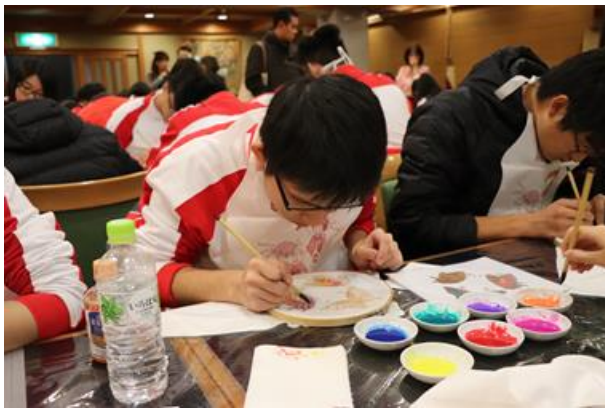
聚精匯神，添上色彩