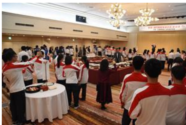
歡迎會上大家齊舉杯