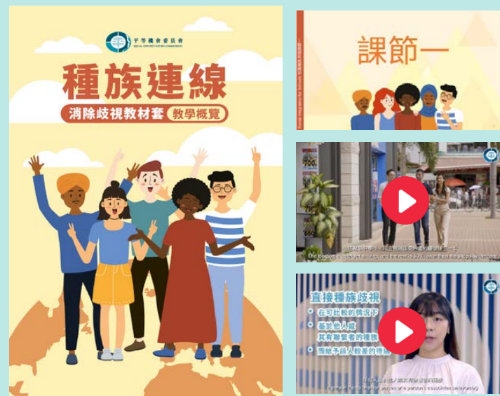
《種族連線》消除歧視教材套