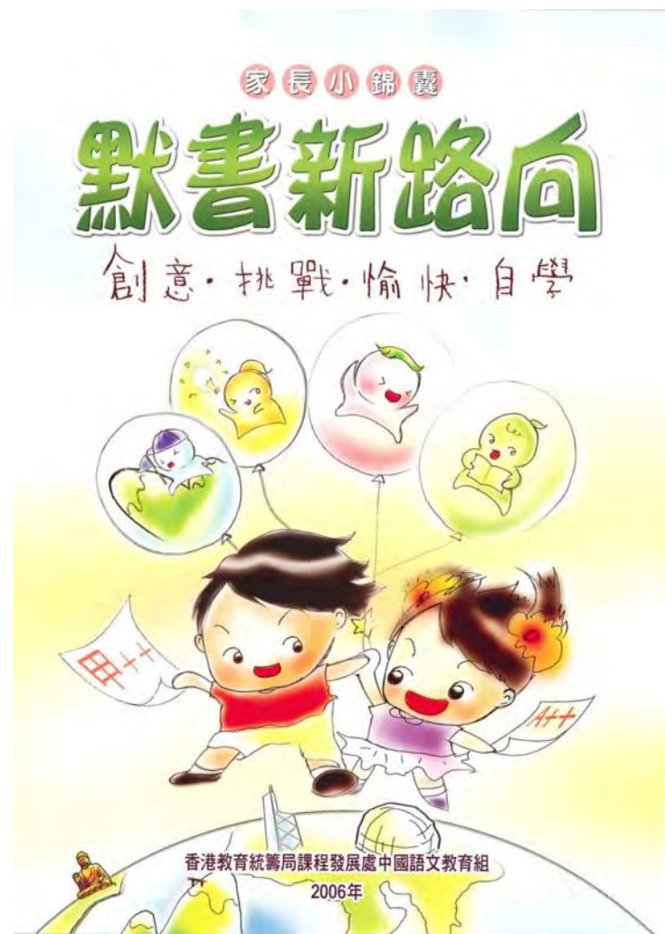
香港教育統籌局課程發展處中國語文教育組 (2006)