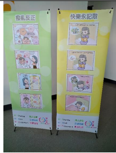
4. 「X-框」PVC 海報 (60cm x 160cm)